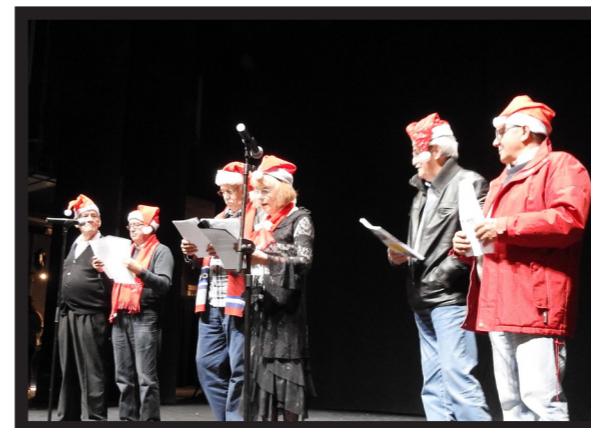
A TURMA DE JORNALISMO E COMUNICAÇÃO APRESENTOU UM CONTO DE NATAL