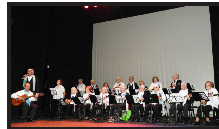
TOCATA DE CAVAQUINHOS INTERPRETOU OS TEMAS 'FADO DO CACILHEIRO' E 'É NATAL'