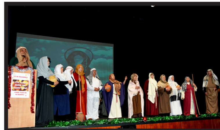
O GRUPO DE TEATRO DA UTIS, REPRESENTOU "A VIDA DE CRISTO"