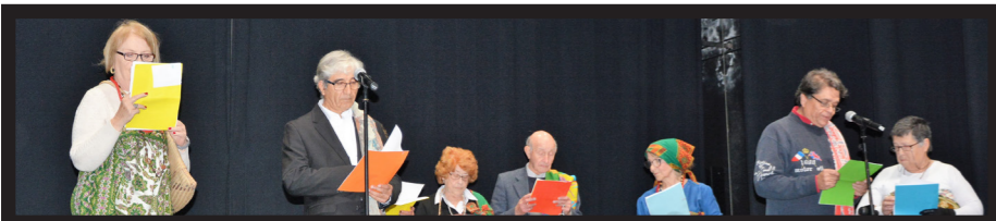
LITERATURA AFRICANA COM TRÊS TEMAS: 'NATAL AFRICANO' DE CABRAL NASCIMENTO, 'NATAL' DE RUI NORONHA E 'NATAL NEGRO' DE ARTUR FONSECA