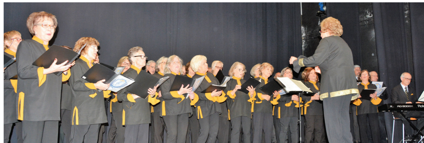
CORO INTERPRETOU ODE À ALEGRIA DE BEETHOVEN, E CANTICORUM JUBILO, DE HÄNDEL

A Festa de Natal da Universidade da Terceira Idade de Santarém (UTIS) teve lugar no passado dia 12, no Teatro Sá da Bandeira, em Santarém.