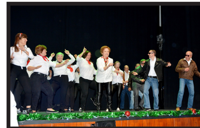
A TURMA DE DANÇAS DE SALÃO RECREOU 'GREASE'