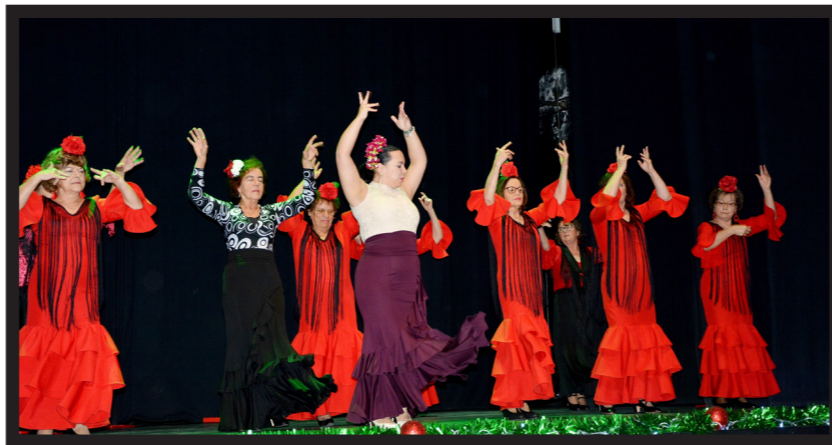
SEVILHANAS COM DOIS ESTILOS DIFERENTES DE DANÇAS: RUMBA E SEVILHANA