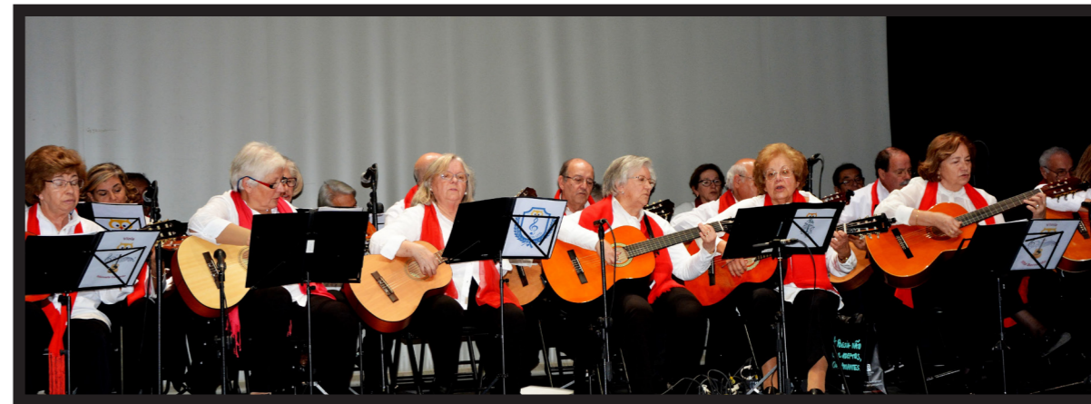
TURMA DE VIOLAS INTERPRETOU 'POSTAL DOS CORREIOS' DOS 'RIO GRANDE' E 'NOITE FELIZ'