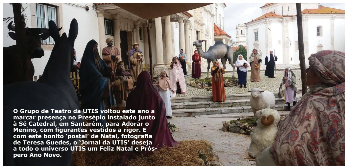
O Grupo de Teatro da UTIS voltou este ano a marcar presença no Presépio instalado junto à Sé Catedral, em Santarém, para Adorar o Menino, com figurantes vestidos a rigor. E com este bonito 'postal' de Natal, o 'Jornal da UTIS' deseja a todo o universo UTIS um Feliz Natal e Próspero Ano Novo.