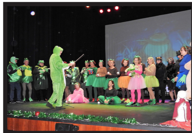
A TURMA DE INGLÊS INTERPRETOU UM ORIGINAL DE SIR PAUL MCCARTNEY 'WE ALL STAND TOGETHER'