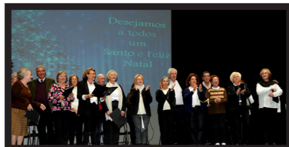
MUNDO ACTUAL, LITERATURA PORTUGUESA E GERONTOLOGIA SOCIAL, TROUXERAM À FESTA TRÊS POEMAS: 'POEMA AOS HOMENS CONSTIPADOS', DE ANTÓNIO LOBO ANTUNES (MUNDO ACTUAL), 'DIA DE NATAL', DE ANTÓNIO GEDEÃO (LITERATURA PORTUGUESA) E 'SINAIS DA JUVENTUDE', DE MADALENA SEQUEIRA (GERONTOLOGIA SOCIAL)