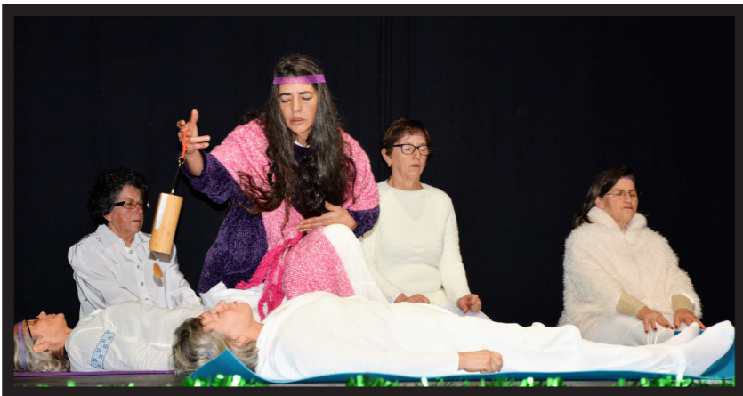
TURMA DE MEDITAÇÃO EM MOMENTO ZEN