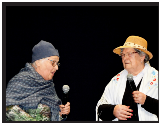
RÁBULA HUMORÍSTICA, PORQUE "RIR É O MELHOR REMÉDIO"