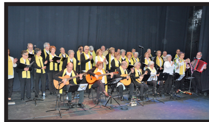
TUNA APRESENTOU TRÊS CANÇÕES: 'VIRA DA MINHA RUA', 'ENTÃO É NATAL' E 'ESTUDANTINA DA TUNA'