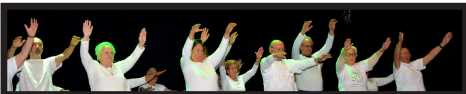
A TURMA DE GINÁSTICA APRESENTOU UMA PEQUENA MOSTRA DE COMO OS ALUNOS SE EXERCITAM NA AULA